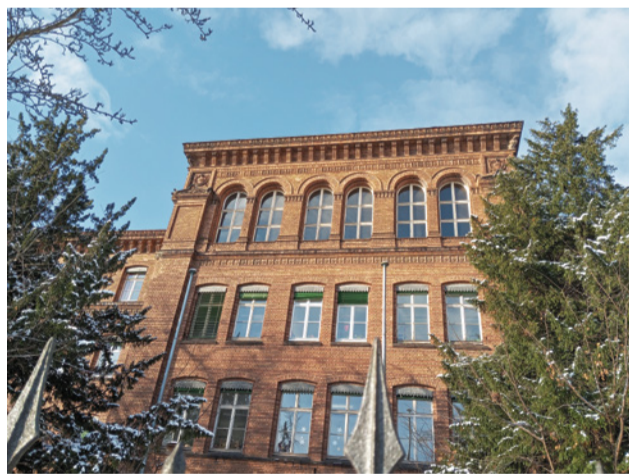
Die Johann-August-Zeune-Schule bildet seit 1806 Blinde und Sehbeeinträchtigte aus

Vorangegangen war eine Initiative Valentin Häuys, der die weltweit erste Blindenschule in Paris gegründet hatte. Die blinde Konzertpianistin Maria Theresia Paradis hatte ihn derart fasziniert, dass er sich für die Ausbil-