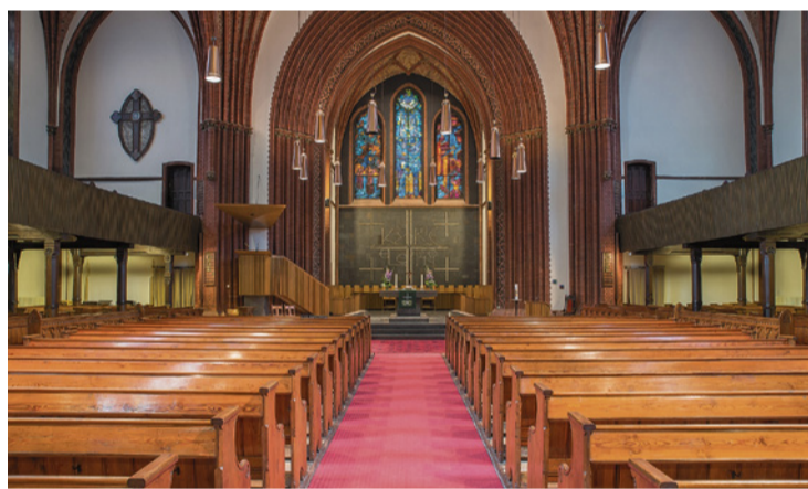
Ev. Matthäus-Kirchengemeinde Berlin-Steglitz

In der Winterzeit zieht Berlin sich gern in warme Räume zurück. Aber es gibt viele Menschen, die frieren müssen – weil sie keine Wohnung haben oder weil die Kosten für Energie und Nahrungsmittel so hoch sind. Die Menschlichkeit einer Gesellschaft zeigt sich daran, zu helfen, wenn Hilfe nötig ist. In Steglitz heißt das, es gibt die Ausgabestelle Laib und Seele für bedürftige Menschen in den Räumen der Matthäus-Gemeinde, Schloßstraße 44, 12165 Berlin – und zwar schon seit dem 10. Januar 2008. Die Ausgabe von Lebensmitteln erfolgt jeden Donnerstag ab 14:00 Uhr für einen Euro Eigenbeitrag. Die Anmeldung ist von 13:30 bis 14:00 Uhr mit Vorlage eines Bescheides über das Einkommen und des Personalausweises möglich.