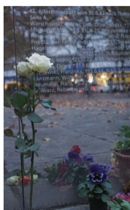
Die Spiegelwand am Hermann-Ehlers-Platz erinnert an die Deportation und Ermordung Steglitzer Juden

Wir müssen begreifen, mit welchen Traumata und Ängsten Jüdinnen