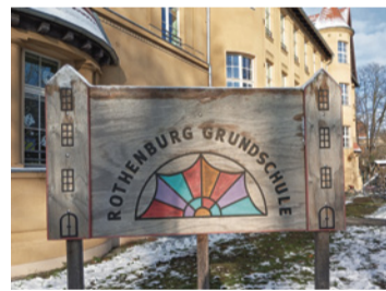
Die Rothenburg-Grundschule setzt seit über 30 Jahren auf ein inklusives Konzept