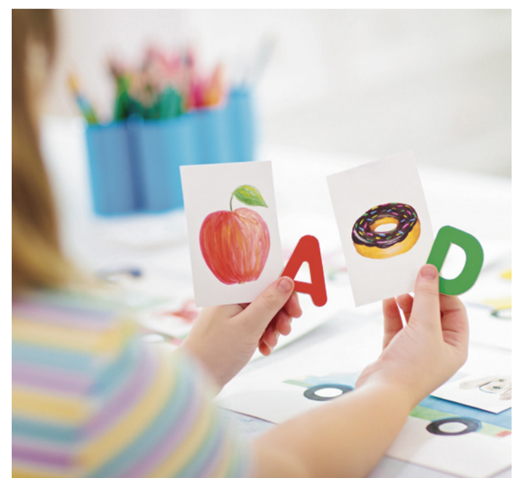
Frühkindliches Sprachtraining mit Buchstaben und Bildern

Amara jedenfalls freut sich auf das Spielen und Sprachtraining mit anderen Kindern. Ihre Zukunft kann kommen, sie wird bestens vorbereitet sein.