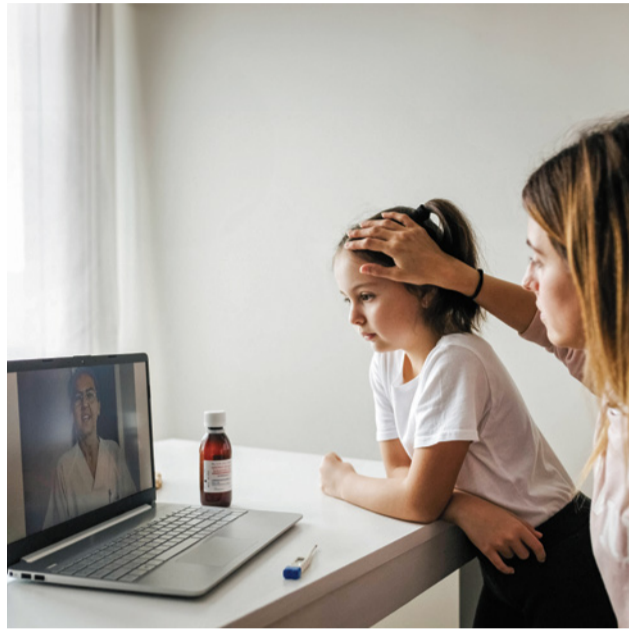
Unseren Kindern gebührt Aufmerksamkeit und schnelle Hilfe

Gleichzeitig würde aber auch das Personal in Rettungsstellen und Notdienstpraxen entlastet werden. Als Vorbild dient der in München seit mehr als drei Jahrzehn-