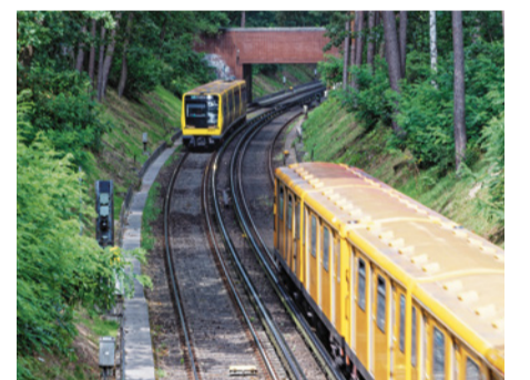
U-Bahnlinie 3 soll verlängert werden

Die Verlängerungen der U-Bahnlinie 3 von Krumme Lanke bis Mexikoplatz sowie der U-Bahnlinie 8 bis ins Märkische Viertel sind jetzt beschlossene Sache.