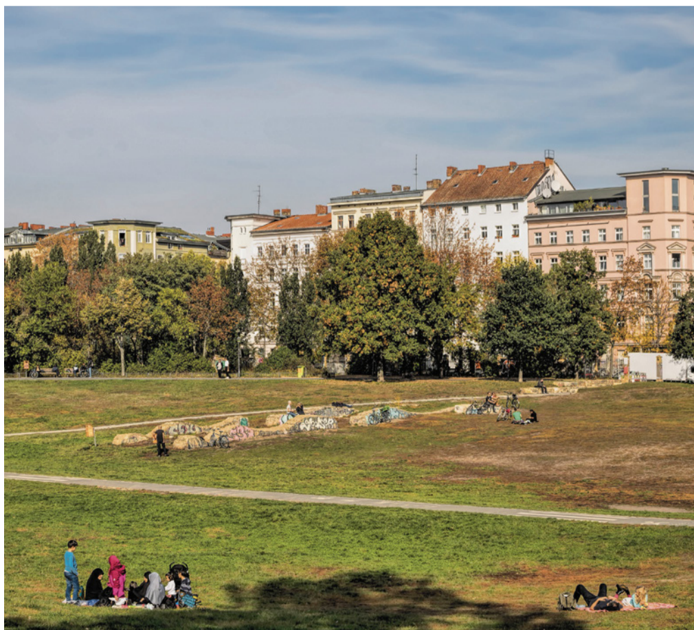
Grüne Oase inmitten der Stadt: Der Görlitzer Park soll für Besucher sicherer werden

Mit Zäunen, verschließbaren Zugängen und Beleuchtung, auch mit zurückgeschnittenen Bäumen und Büschen sollen Dealer und andere Kriminelle ferngehalten werden. Dazu kommen verstärkte Polizeieinsätze und