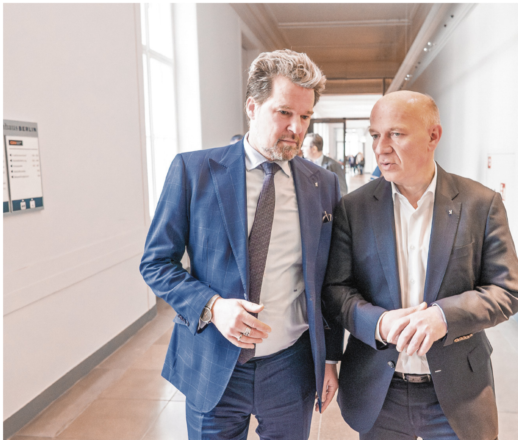
Berlins Regierender Bürgermeister Kai Wegner mit CDU-Fraktionschef Dirk Stettner im Abgeordnetenhaus