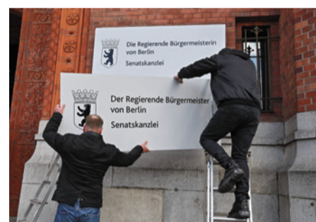
Schilderwechsel: Regierender Bürgermeister

abschiedung des Haushalts 2024/2025 ein elementarer Bestandteil dieser Zusammenarbeit in der Koalition im ersten Jahr. Wir hatten schwierige Voraussetzungen, einen Haushalt, der schuldenbremsenkonform erlassen werden muss, der uns von den Vorgängern aber mit einem deutlichen Einnahmefizit übergeben wurde. Gleichzeitig natürlich auch steigende Anforderungen an unsere Krisenresilienz in den Bereichen Zivilschutz und Klimaschutz und dringend benötigte Investitionen in unsere Infrastruktur. Wir haben in der Koalition geschafft, diese Spannungsfelder zu lösen und einen ordentlichen Haushalt aufzustellen. Das sind die Aufräumarbeiten und Fundamente. Jetzt können wir bauen.