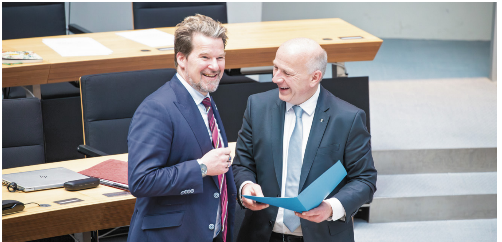
Berlins Regierender Bürgermeister Kai Wegner und CDU-Fraktionschef Dirk Stettner im Plenarsaal des Berliner Abgeordnetenhauses