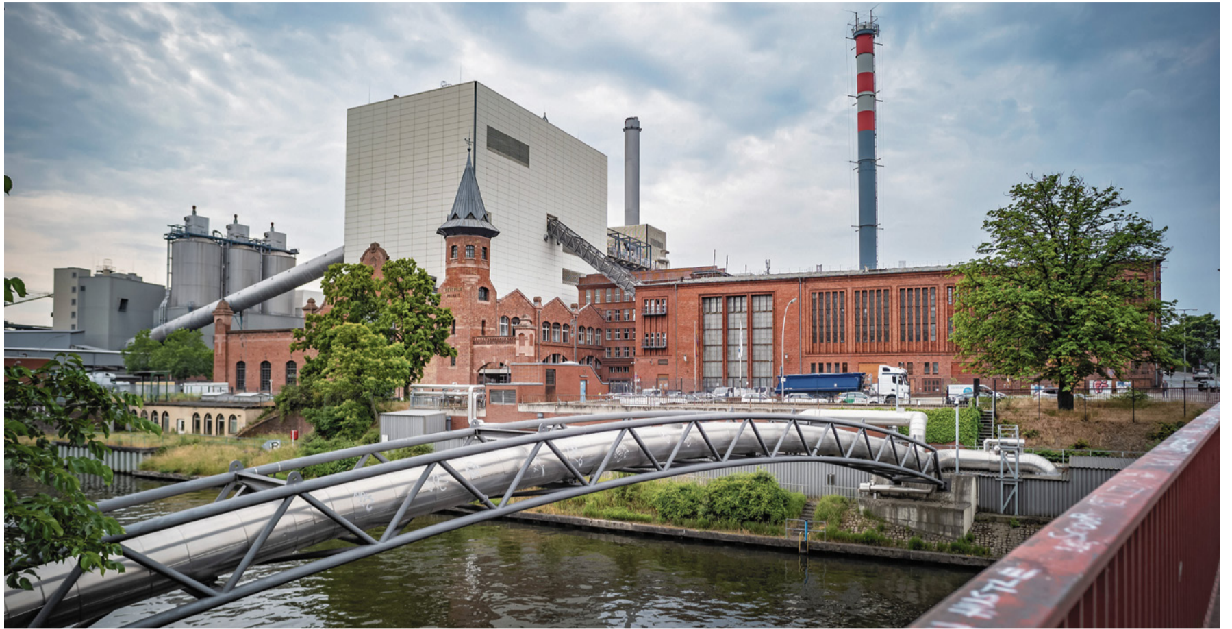
Wärme Kraftwerk Moabit, Friedrich-Krause-Ufer