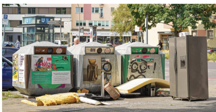
Illegal abgelegte Matratzen und anderer Abfall

Straßen, Parks und Plätze zu vermüllen, gilt in Berlin bisher eher als Kavaliersdelikt: selten geahndet, zu geringe Sanktionen. Mit der Bußgelderhöhung soll nun die Motivation bei den Ordnungsamtsmitarbeitern und zugleich die Abschreckung vor solchen Taten steigen, heißt es in der CDU-Fraktion. Mit den Einnahmen ließen sich Müll-Ermittler finanzie-