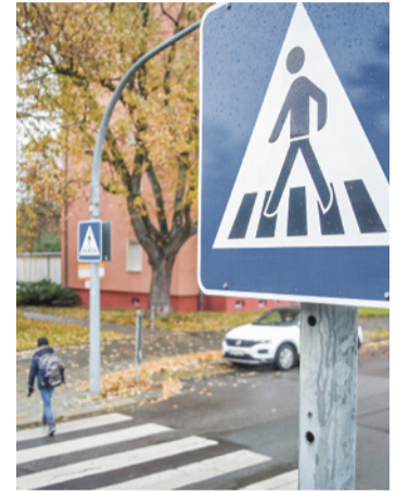
Schneller zu sicheren Überwegen

Mit einem Sofortprogramm wird der Bau von Fußgängerübergängen (Zebrastreifen) beschleunigt. Planung, Vergabe, Durchführung und Finanzierung ist jetzt Sache der Bezirke. Damit wurde eine klare Zuständigkeit geschaffen.