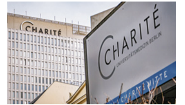
Berlins Charité zählt zur Weltspitze

In einem weltweiten Krankenhaus-Vergleich der US-Wochenzeitung Newsweek verbesserte sich die Berliner Charité um einen auf den sechsten Platz. Unter den deutschen Häusern hält sie weiter den Spitzenplatz vor dem Bundeswehr-Krankenhaus und dem Helios-Klinikum in Buch.