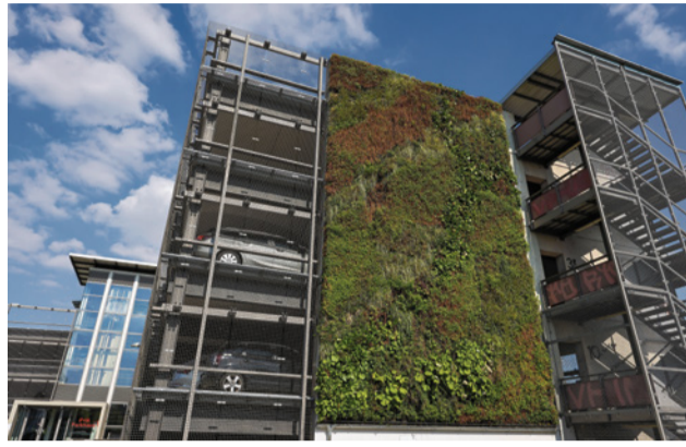
Wohnortnahe Parkhäuser können Straßen entlasten

Das Problem hat auch die Koalition im Berliner Abgeordnetenhaus erkannt. Die CDU-Fraktion plant jetzt sogenannte Kiezparkhäuser. Sie sollen für Entlastung sorgen und die Parksuchverkehre aus den Kiezen holen. Gleichzeitig könnte dort mit entsprechender Ladeinfrastruktur der Umstieg auf Elektroautos erleichtert werden, der gerade für Mieterinnen und Mieter je nach Wohnanlage nicht mal eben so zu machen ist. Zusätzlich könnten Kiezparkhäuser Platz schaffen, wenn durch Kiezparkhäuser netto mehr