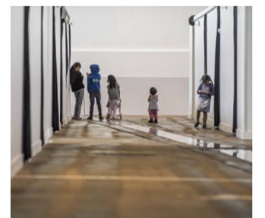
Tempelhof: mehr Platz für Flüchtlinge

Am Standort Tempelhof werden mehr Kapazitäten für die vorübergehende Aufnahme von Flüchtlingen geschaffen. Damit wird sichergestellt, dass angesichts steigender Zahlen nicht noch einmal Beschlagnahmen etwa von Turnhallen erforderlich werden.