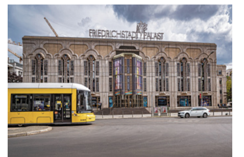
Berliner Kultur: Friedrichstadtpalast

Die Berliner Bühnen und Orchester konnten im vergangenen Jahr insgesamt rund drei Millionen zahlende Besucherinnen und Besucher anlocken. Damit sind die Besucherzahlen wieder auf dem Niveau vor der Corona-Pandemie. Eine tolle Bestätigung für die Kulturschaffenden in Berlin. Die Bühnen und Orchester sind damit nicht nur ein tolles Angebot für die Hauptstädter, sondern auch ein wichtiger Faktor für den Tourismus.