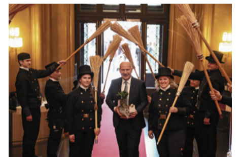
Spalier der Schornsteinfeger für Kai Wegner