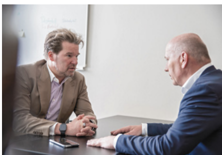
Stets in enger Zusammenarbeit

Wegner: Ich glaube, es gibt nicht den einen größten Moment oder den größten Erfolg. Es geht darum, dass diese Stadt an sich jetzt schon viel besser funktioniert als noch vor einem Jahr. Nehmen wir beispielsweise das vergangene Silvester. Die Ausschreitungen blieben nahezu vollkommen aus. Wenn wir über das Thema Bauen sprechen, sorgen wir mit der Novelle der Bauordnung und dem Schneller-Bauen-Gesetz, dass bezahlbarer Wohnraum schneller entsteht. Wir werden die U- und S-Bahnen ausbauen und dafür sorgen, dass die Außenbezirke eine bessere Anbindung bekommen. Wir haben 100 neue Stellen für die Bürgerämter beschlossen, davon sind jetzt schon 80 besetzt; zwei neue Standorte für Bürgerämter kommen hinzu. Und wir bieten mehr Dienstleistungen digital an. Das sind nur wenige Beispiele, an denen man sieht, wie sich Berlin im vergangenen Jahr zum Besseren verändert hat. Und wir haben noch sehr viel vor.