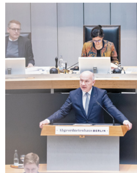
Kai Wegner, Regierungserklärung