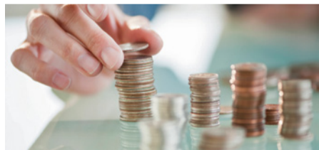
Knappes Gut: Mit Berlins Geldern klug umgehen

Mit diesem Dreiklang wird die Zukunftsfähigkeit Berlins finanziert, denn am Anfang jeder Veränderung steht bei solider Haushaltspolitik die Finanzierung im Landeshaushalt.