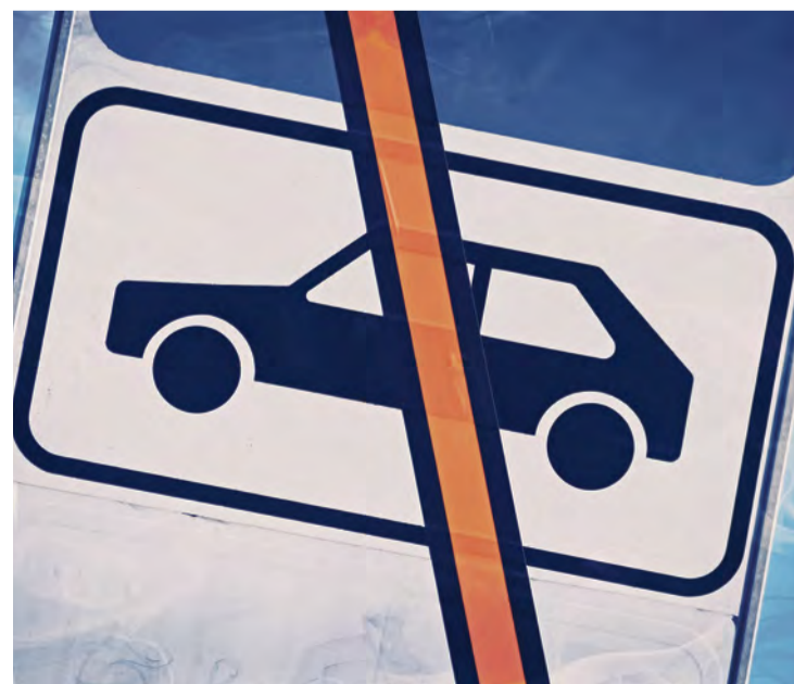
Autoverbot in Berlin? Die CDU-Fraktion ist entschieden dagegen

Der Volksentscheid „Berlin autofrei“ ist schlecht gemacht und auch nicht gut gemeint. Er ist realitätsfern, elitär und spaltet die Stadt in Zentrum und Stadtrand, in Ideologie und Alltag. Niemand soll sich schämen müssen, Auto zu fahren. Die CDU-Fraktion lehnt deshalb diese Initiative klar ab. Berlin braucht Mobilität für alle – und eine Verkehrspolitik, die verbindet und nicht ausgrenzt.