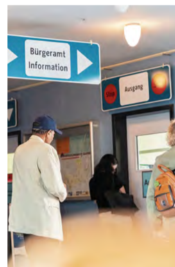
Ins Bürgeramt jetzt auch ohne Termin

Ist eine sofortige Bearbeitung nicht möglich, erhalten Besucherinnen und Besucher direkt im Bürgeramt einen zeitnahen Ersatztermin . Online-Termine bleiben weiterhin möglich.