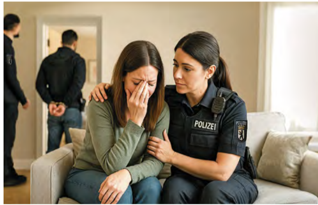
Mehr Trost und Schutz vor Gewalt für Berlins Frauen

Mit einem neuen Paragraphen werden sensible Identitäts-