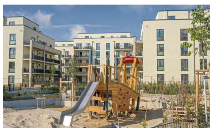
Wohnungsneubau wie hier in Haselhorst (Spandau) und Mieterberatung haben Priorität

Berlins Mietpreisprüfer sehen ganz genau hin und entdeckten in vielen Fällen sogar Überschreitungen von mehr als 50 Prozent der Vergleichsmiete – Verdacht auf Mietwucher,