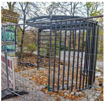
Zaunschutz für den Görlitz

Im Görlitzer Park in Kreuzberg ist das erste neue Eingangstor mit Drehkreuz installiert worden, dazu ein erster Abschnitt des geplanten Metallzauns entlang der Wiener Straße. Der zwei Meter hohe Zaun ist Teil eines Sicherheitskonzepts des Senats, das insgesamt 16 Stahlöre und acht vandalismussichere Drehkreuze vorsieht. Künftig soll der Park nachts geschlossen werden, um Drogenhandel und Kriminalität stärker einzudämmen. Die Ergebnisse des Sicherheitsgipfels werden weiter umgesetzt.