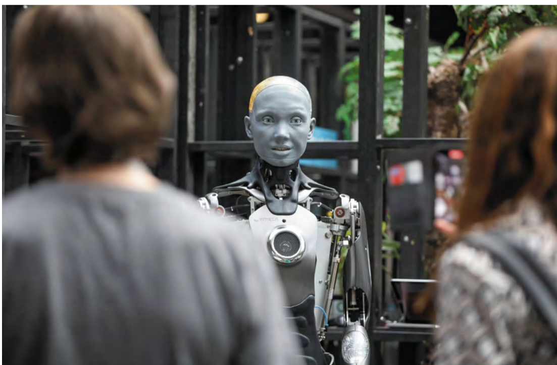
Digitale Neuheiten beleben Berlins Wirtschaft

Eine Sonderkonjunktur und bundesweiten Aufschwung erwarten Experten durch das milliarden schwere Sondervermögen der CDU-geführten Bundesregierung. Berlin kann hier mit rund 5,25 Milliarden Euro zusätzlich rechnen für Instandsetzung und Ausbau von Bauwerken bis hin zum Nahverkehr. Wie die CDU geführte Koalition in Berlin die Gelder verwenden wird? Antworten dazu finden Sie auf Seite 2.