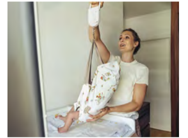
Hebamme wiegt ein Baby

Die Kurse für künftige Hebammen an der Charité sind finanziell gesichert. Die CDU-geführte Koalition verständigte sich darauf, dafür drei Millionen Euro in den beiden kommenden Jahren bereitzustellen.